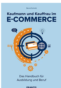
Kaufmann und Kauffrau im E-Commerce Kap 2.11.3: Verschlüsselung mit SSL-Zertifikat